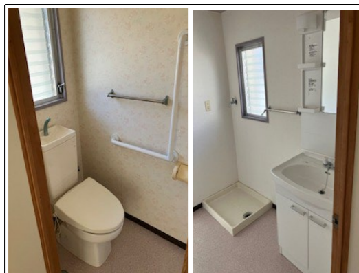
清潔感のあるトイレ・洗面所