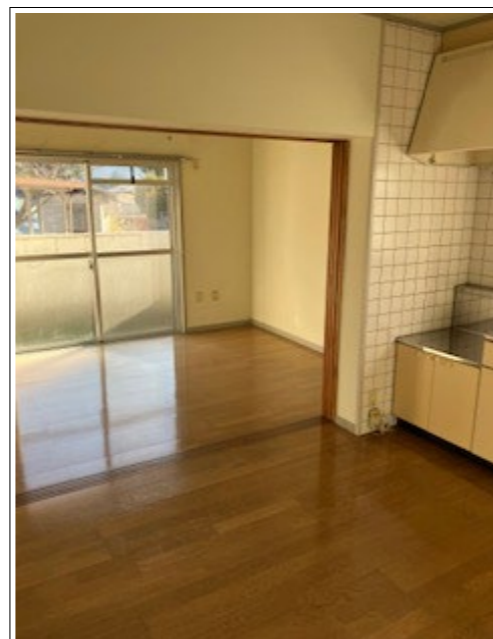
日当たりの良いリビング