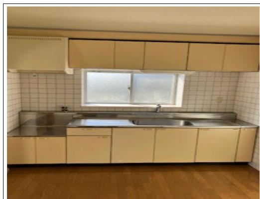
収納が充実した使いやすいキッチン