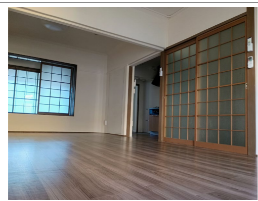
子供の成長を見据えた大きなリビング