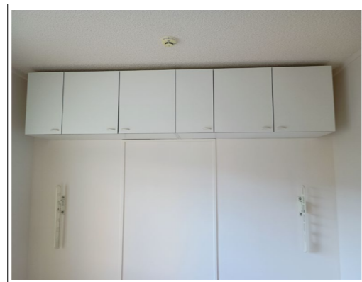
吊戸棚・上下可動式の物干し