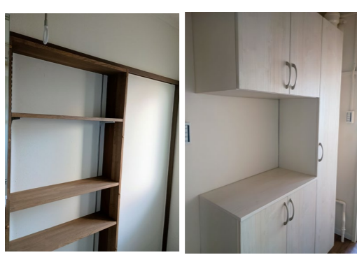
バスルーム棚・30以上の玄関靴箱