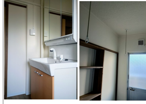
バスルームに雨でも干せる物干し設置