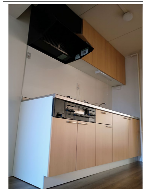
マグネットパネル付システムキッチン