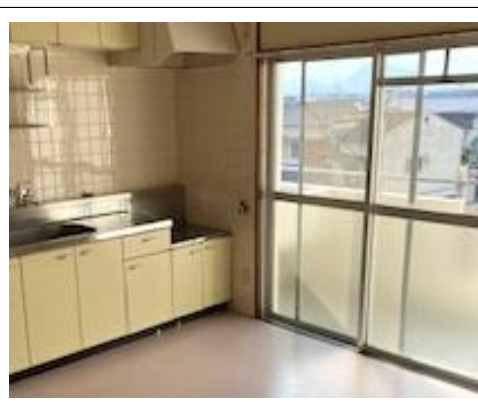
開放感あるダイニング・和室