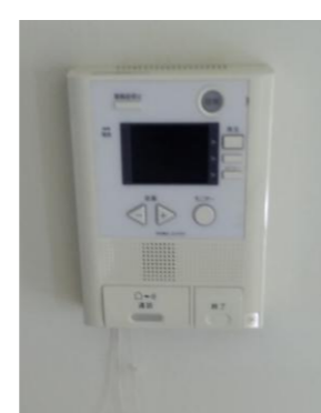
カメラ付インターホン