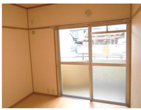
開放感あるダイニング・和室